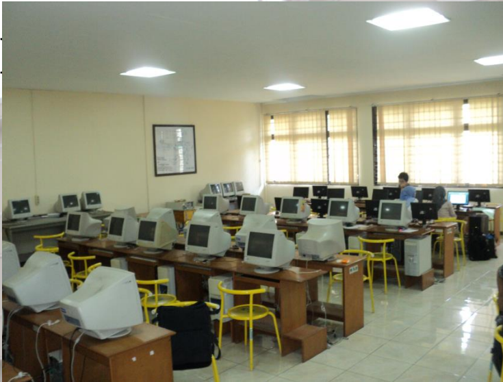
LABORATORIUM KOMPUTER dengan ruangan Yang memadai dan mutakhir