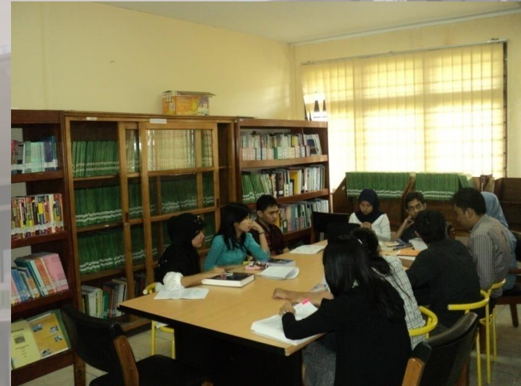
PERPUSTAKAAN & INTERNET (Electronic Library) dengan ruang AC yang nyaman, text book lebih dari 694 judul (2133 ex), majalah & CD Kedokteran, dan 24 jam akses gratis internet