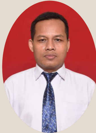
Wartam Anggota TIM BK FK