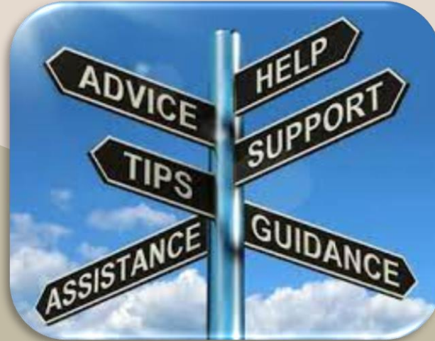
INTERVENSI / PENDAMPINGAN